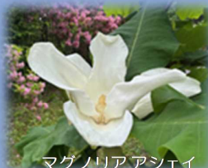
マグノリアアシェイ