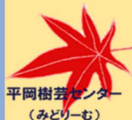
平岡樹芸センター (みどりーむ)