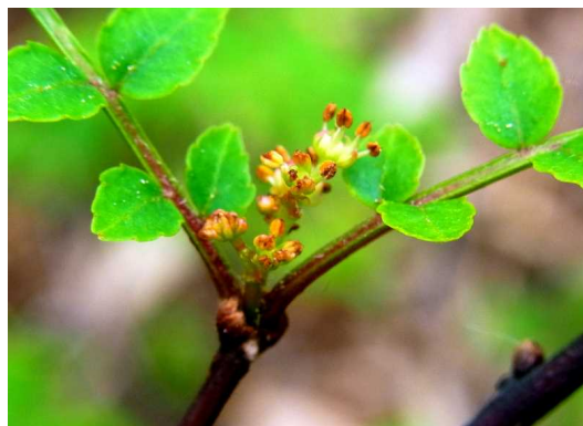
サンショウの雄花

サンショウはミカン科なのでアゲハチョウやカラスアゲハなどの食草となります。成虫が飛来し卵を産み付け、幼虫が好んで食するため、短期間で食害され葉がなくなってしまうます。気を付けましょう。