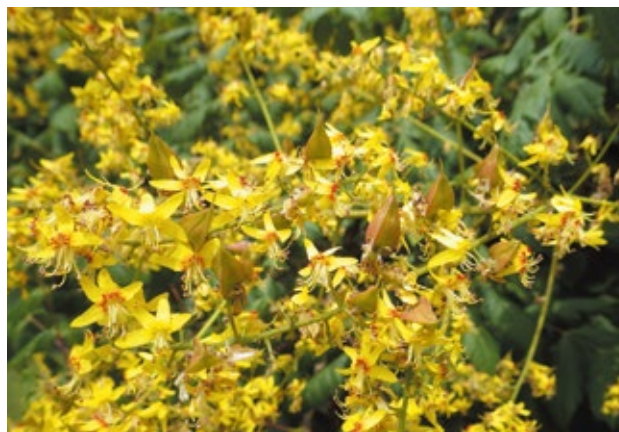
場所：花木園 モクゲンジ 学名 Koelreuteria paniculata

Toyohira Park is located at the former site of the Forest and Forest Products Research Institute, the Ministry of Agriculture, Forestry and Fisheries. The beautiful flowerbeds and gardens of the Greenery Center spread out before you at this spacious park of approximately 7.4 ha. Wild birds rest in woods of coniferous and broadleaf trees. You can enjoy sports facilities such as tennis courts and heated swimming pools.