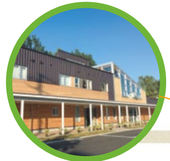
札幌市緑化植物園 緑のセンター Sapporo Greening Botanical Garden Greenery Center