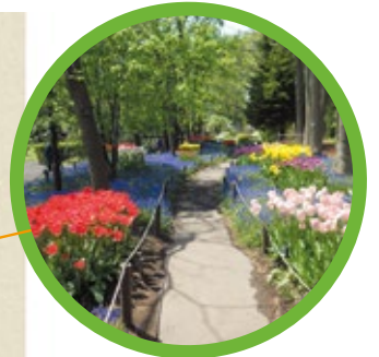
ムスカリの小径 Alley of grape hyacinths (Muscari)