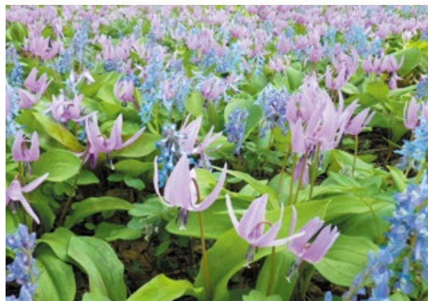
場所：野草園 カタクリ・エゾエンゴサク Erythronium japonicum / Corydalis ambigua

There are two pools in the two-storied building: one for general use and another for small children. Hours: 10:00 a.m.-9:00 p.m. Free admission for students of junior high school age or younger. For information, phone 011-813-6556.