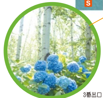
シラカンバ林 Japanese white birch trees