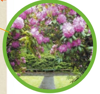
花木園 Shrub and Rose Garden