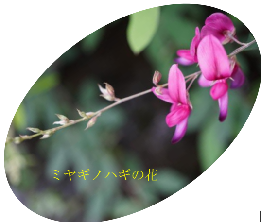
ミヤギノハギの花

また、もう一つハギとしてよく見られるヤマハギ( L. bicolor )は枝が殆ど枝垂れないことと、葉の先が円形であることがミヤギノハギとの大きな違いです。