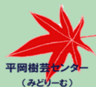
平岡樹芸センター （みどりむ）