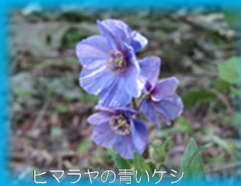
ヒマラヤの青いケシ