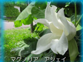
マグノリア アシェイ

清々しい夏の気配が広がる頃、リリートレインの車窓からウツギやルピナス、ハマナシやシャクヤクなどを眺め楽しむことができます。また、ヒマラヤの青いケシやマグノリア アシェイといった百合が原公園だからご覧いただける植物や、北国の風土に合った約180種類ものバラや早咲きのユリなど、初夏を彩る植物たちの開花リレーをお楽しみください。