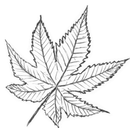
キョウガノコの葉

ちなみにシモツケの名は下野国（栃木県）に多く自生していることから、シモツケソウはシモツケに似ていることから名付けられそうです。