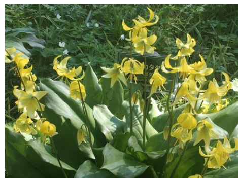
豊平公園野草園の キバナカタクリ ‘パゴダ’

このキバナカタクリは日本原産ではなく、北アメリカ原産で、和名の通り黄色の花が咲くカタクリです。豊平公園にあるのは‘パゴダ’ (‘Pagoda’) という園芸種です。