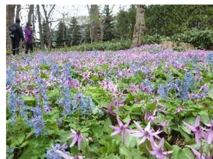
豊平公園野草園で開花中の カタクリ ( E.japonicum ) 群落

豊平公園の野草園ではこの紅紫色のカタクリは元からある群落より広がってきていますが、キバナカタクリは一部にまとまったままあまり広がる様子はありません。カタクリはアリによる拡散が言われていますが、キバナカタクリはないのでしょうか。疑問な部分ではありますが、どちらも6月後半には地上部が姿を消し、地下で来年の開花に備えているのは間違いありません。