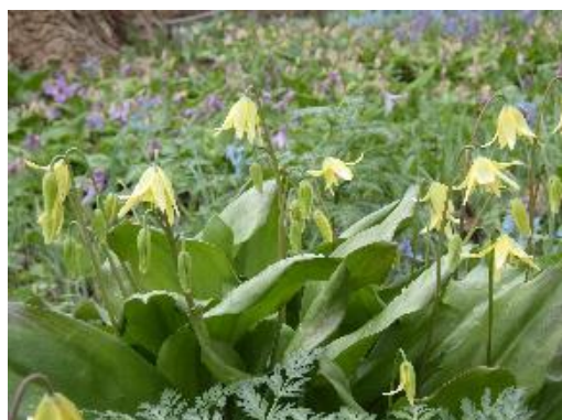
キバナカタクリの奥に花終わりの カタクリとエゾエンゴサクがみえる

‘パゴダ’ は花茎が高さ 30cm 位になり、黄色の星状の花を1球から数本つけます。葉に斑点がないことと、濃黄色の花をつけるのが特徴です。‘パゴダ’ は E. tuolumnense (ツオルムネンセ) を片親とし、他種と交配された雑種が園芸種として普及したものです。