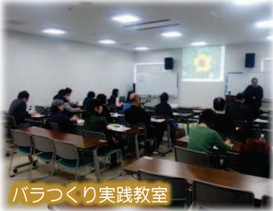
バラづくり実践教室