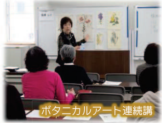
ボタニカルアート連続講