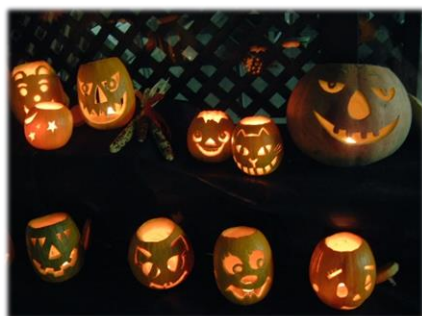
ジャック・オ・ランタン

カボチャにユニークな顔をくり抜き提灯にした「ジャック・オ・ランタン」は、今やハロウィンのシンボルになりましたが、かつてハロウィンが生まれたイギリス諸島ではカブで提灯を作るのが一般的でした。19 世紀の後半にイギリス諸島から多くの移民がアメリカ移住し、その地でこの季節に多く獲れるカボチャを利用しそれが徐々に定着したことが始まりです。今でもスコットランドでは「ニープ・ランタン」としてセイヨウアブラナの変種であるスウェーデンカブが用いられています。