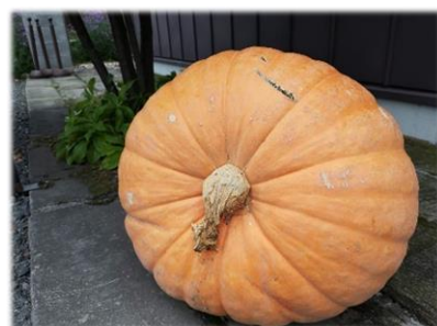
アトランティックジャイアント

今やハロウィンには欠かせないオレンジ色のカボチャはペポカボチャに属します。他にもカラフルで可愛い「おもちゃカボチャ」から重さ 100 kg を超える「アトランティックジャイアント」まで大きさや見た目も様々で、中には「プッチーニ」や「錦甘露」など食用可能のものもあります。家庭菜園でも人気のズッキーニ、茹でると麺のようになるそうめんカボチャ（金糸瓜）もペポカボチャの仲間です。