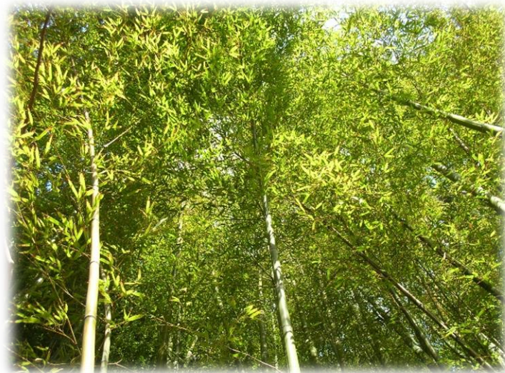
モウソウチクの竹林

タケの成長は速く、マダケ（ P. bambusoides ）では 1 日に 121cm 伸びた記録があります。これは多くの植物が茎の先端にのみ成長点があるのに対し、タケは節ごとに成長帯があり、それらが一斉に細胞分裂をするためです。ただし形成層がないため芽が出た後太さに変化はなく、50～100 日後には伸長も止まり、株元や地下茎から次々と新しい稈（かん、タケの茎）が発生し、大きな株立ちや竹林を形成します。