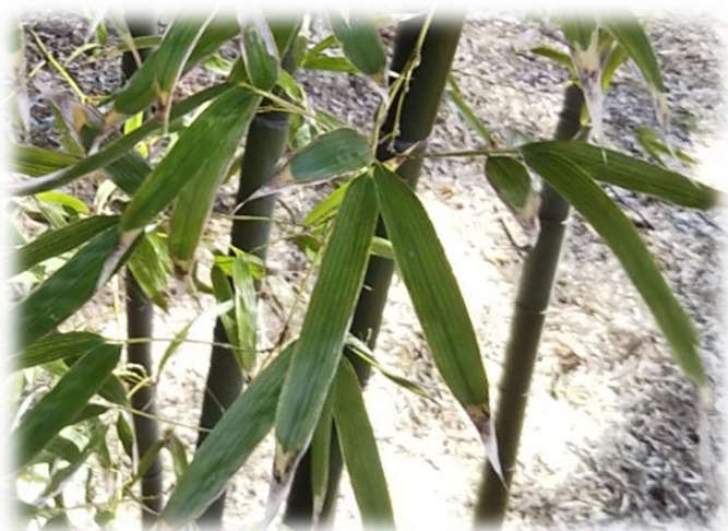
モウソウチクの葉

タケ（ササを含む）はイネ科タケ亜科に属し、世界に約 1,300 種あります。日本には約 240 種があり、稈鞘（かんしょう、タケノコの皮）が成長と共に脱落するものはタケ、長く残るものはササとされていますが、海外ではこのような区別はありません。道内には広く分布するクマイザサ（ Sasa senanensis ）、山菜や雪囲いの資材として重要なチシマザサ（ S. kurilensis ）、葉の隈取りが美しいミヤコザサ（ S. niponica ）、太平洋側の一部に分布するスズタケ（ Sasamorpha purpurascens ）の 4 種があります。