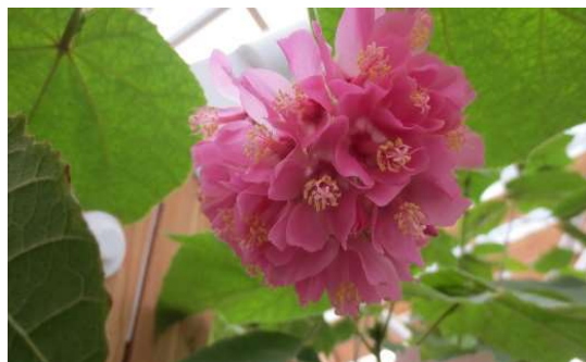
ドンベヤの花（H30. 12. 15 撮影）