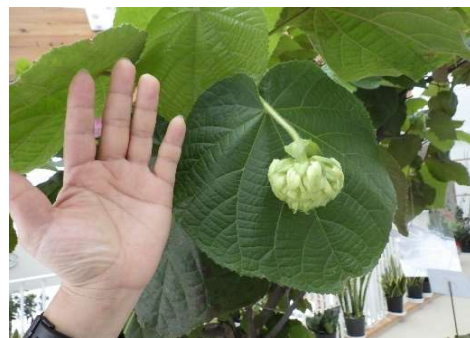
夏場はさらに大きな葉になることも