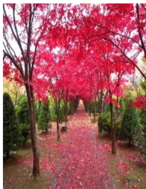
ノムラモミジの並木

その中でも日本庭園の園路沿いにヤマモミジの台木に高接ぎされたマイクジャク、ベニシダレモミジの接木株があり、1 本で 3 種類のカエデが楽しめるモミジとして珍重されています。外見からは継ぎ目が目立たないため、このような樹木がどうして出来るのか、と多くの人が立ち止まります。