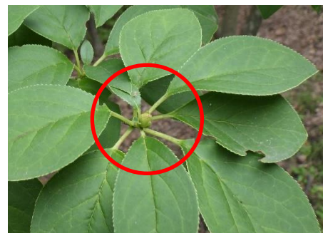
↑サラサドウダンの花芽