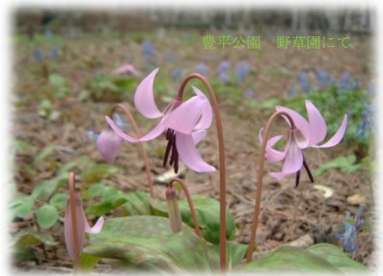
豊平公園 野草園にて