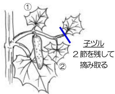
きゅうりのわき芽掻き