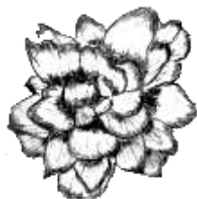
フリンジドフォーム

球根性ベゴニアのうち、特に「球根ベゴニア」と呼ばれる種類は、アンデス山脈原産の球根性ベゴニアを起源として、複雑な交配の繰り返しによって作出された球根を有する園芸品種の総称です。