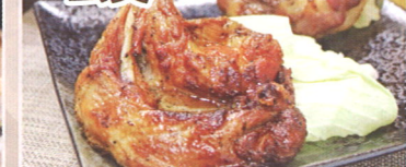
16.香川県丸亀市 NEW 玄奥

丸亀のソウルフード「骨付鳥」。ニンニクとスパイスが効いた骨付き鶏モモを丸ごと焼き上げる豪快グルメ!