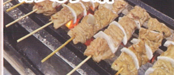
7.福岡県久留米市 オレたちの絆

串に刺せば何でも焼き鳥!ダラム(豚のホルモン)・牛タン・豚バラ・とり皮など、様々な種類の焼き鳥を堪能出来ます!