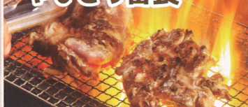
4.長野県上田市 やきどり番長

長野県上田名物の「美味だれ焼き鳥」。ニンニクの効いたタレがたっぷり絡まった焼き鳥は、一度食べたらずみつきに!