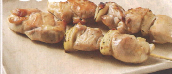
1.北海道砂川市 どり輔

新鮮なお肉を大きめにカットし串打ちした焼き鳥は、食べ応え抜群。とり輔オリジナルの塩でご賞味ください。