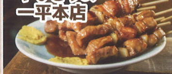
3.北海道室蘭市 やきどりの 一平本店

室蘭のやきとりといえば、豚肉、玉ねぎ、洋からし。創業以来継ぎ足している秘伝の甘辛ダレと洋からしは相性抜群!