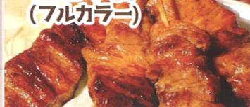
8.沖縄県那覇市 NEW 全色本店 (フルカラニ)

沖縄特産の黒豚アゲー。肉は柔らかく、脂は甘い、上品な旨みです。沖縄ならではの贅沢な味わいを、ご堪能ください。