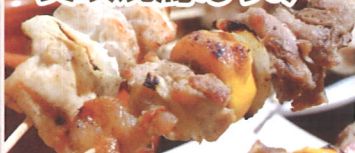
2.北海道美唄市 美唄焼鳥たつみ

親鶏の様々な部位が楽しめる「モツ串」!塩コショウのシンプルな味付けが、親鶏の旨みを際立たせます!