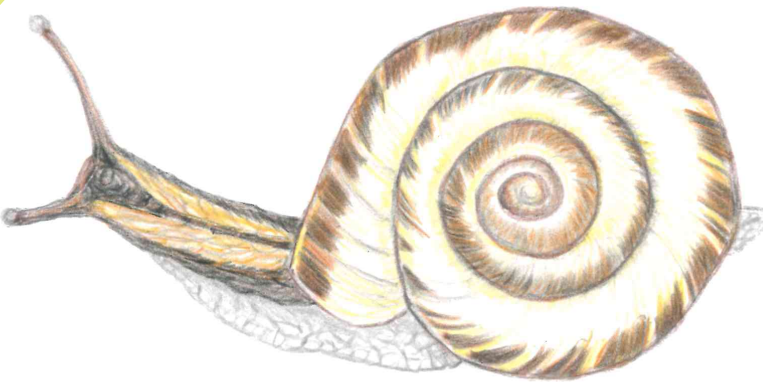
サッポロマイマイ