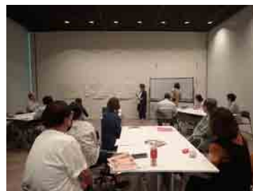
普段の活動のことなどを話しながら、リラックスした雰囲気意見交換が行われました

普段大通公園で活動している認定NPO法人シーズネットのみなさんとも一緒に活動でき、楽しかったですね。