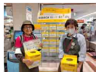
レシートを入れてくれる かどうか、はじめは ドキドキしました

助成金で会の活動を充実できるため、次年度の計画を立てる話し合いでは、「私は図面を描こうかな」など、積極的な意見が出ているそうです。