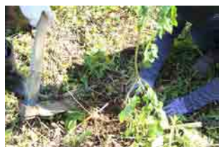
小さな苗木に思いを託して

認定 NPO 法人シーズネット 森づくりサークルは、2006 年から林野庁石狩森林営林署と森づくりの協定を結んで野幌森林公園で森林再生活動を行っています。2023 年からは「社会貢献の森」0.54ha の土地で、3 ヶ年の活動を計画しています。9 月 23 日は 16 名が参加し、営林署の方に植え方を教わってヤチダモとトドマツの苗木およそ 120 本を植えました。