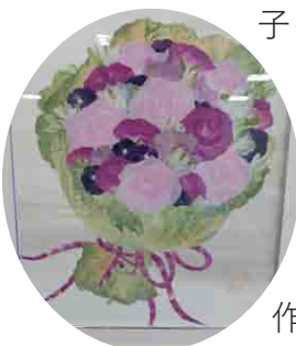
キャベツの外葉がこんなに素敵な作品に♪

2024年度の押し花づくり隊には25名が参加し、ご自宅で作った花や葉の色々な押し花をご提供いただきました。今回集められた押し花は、11月28日に行う花と緑のネットワーク交流会でのワークショップ「押し花のオリジナルカレンダー作り」に使用するなど、花と緑のネットワークの広報活動に使用いたします。