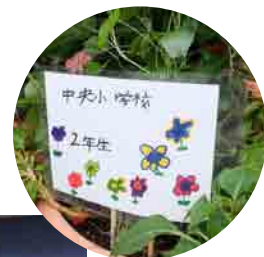
かわいい手描きのイラスト入りプレート

これらのフラワープランターは、10月中旬頃まで沿道に飾られ、企業の方々のメンテナンスによってたくさんの花が咲きました。