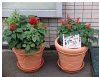
施肥をして大事に育てました

まちづくり体験実習「マイタウン・マイフラワープラン」では、さっぽろタウンガーデナーが札幌市立中央小学校2年生に花の種まき・育苗・寄せ植えの指導を行いました。実習でつくられたフラワープランターは、7月19日に地域企業等へ贈呈され、二条市場などの計14箇所に設置されました。