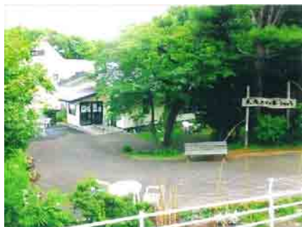
「木洩れびの家」は、自然豊かな旭山地区の一軒家です

社会福祉法人さっぽろ慈啓会 慈啓会特別養護老人ホームが運営している「木洩れびの家」の花壇を再生し、四季折々の花を植え、秋はフラワーリース作り、冬は雪あかりイベントなどを行っています。緑豊かな「木洩れびの家」で、老人ホームの人たちと地域の方、そして花壇ボランティアが、