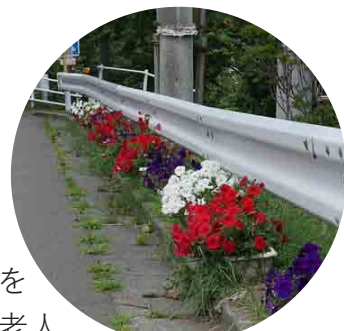
プランターの花が入口までの道を誘います

美味しい珈琲を飲んで交流しながら活動しています。月・水・木・金曜日の10時から15時まで、いつでもどなたでもくつろげる場所ですので、是非一度、お立ち寄りください。