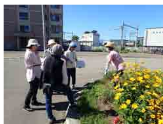
みんなで意見を出し合って 改善しています

時に厳しい意見が出ることもありましたが、互いを思いやりつつ、全員で会の花壇を良くしようと意見を出し合いました。百合が原花壇を造り隊ではこのような活動を毎年行っているのだそうです。