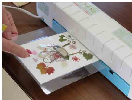
「うまくできたかしら?」ラミネート後のできあかりにドキドキしました