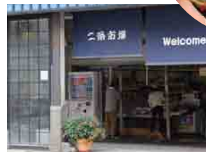
観光で訪れた方の目にとまったでしょうか？