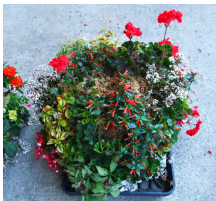
デザイン見本をみてイメージ