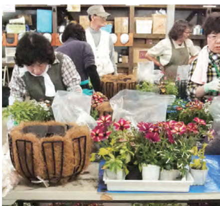
植栽図に合わせて苗を並べていきます