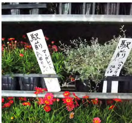
赤・白・紫…色とりどりの苗たち