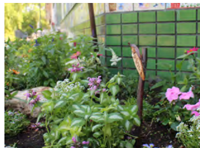
6月のメンテナンス だいぶ大きくなりました。