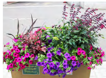
7月のメンテナンス 全体的に様変わりしましたね！