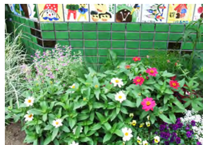
7月のメンテナンス ぐんぐん！勢いよく茂っています