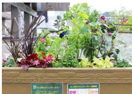
5月の苗植え 緑が初々しい5月のコンテナ

緑が初々しかった植込み当初のコンテナは、2か月経った今では同じものとは思えないほど様変わりしました。まさに「コンテナは生き物」これからも目が離せません！