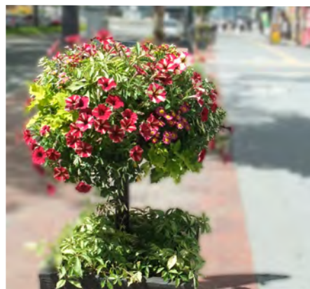
7/15 から札幌駅前通に飾られています