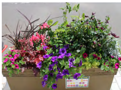
6月のメンテナンス 猛暑でワイルドになりました