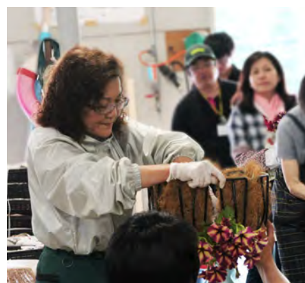
講師の説明を受けながら作っていきます