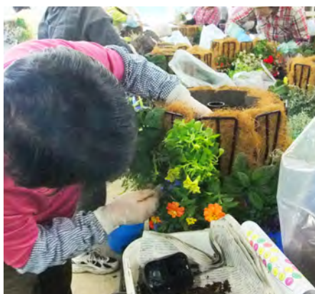
作成中。ポリウム満点ですね！