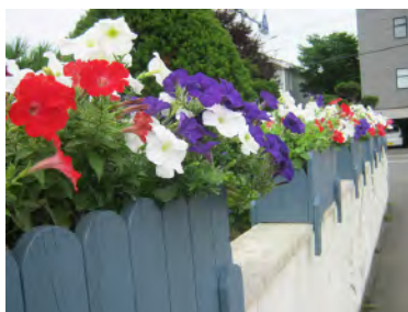
小学校前のプランター