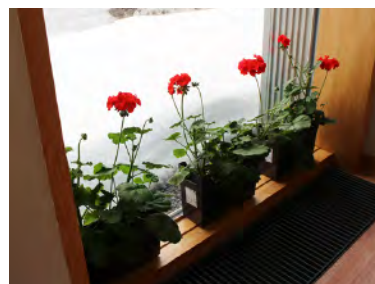
雪の白に映える赤いゼラニウム