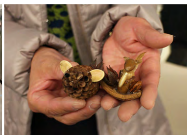
クラフトコーナーの様子