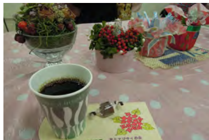
おしゃれなテーブルセッティング