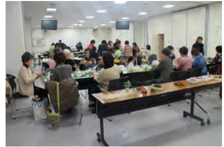
クラフトコーナーの様子