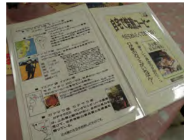
コーヒーについてのご紹介