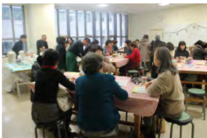
賑わうカフェコーナー

工芸室のカフェコーナーでは、豆から挽いた本格コーヒーがふるまわれ、参加者のみなさんは基調講演の後のひとときをおいしいコーヒーを飲みながら寛いでいました。会場内はクリスマスらしい装飾が施され、また各テーブルにはかわいらしくラッピングした砂糖入れやおしゃれなクラフトが飾られ、楽しい雰囲気を出していました。なかでも緑町公園「花とアジサイの会」メンバー手作りのコースターは好評でした。