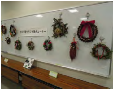
クリスマスリース等の展示

大研修室のクラフトコーナーでは、クリスマスリース等のクラフト作品の展示や、定員各15名で「キャンドルリース」と「マツボックリのクリスマスクラフト」づくりの講習会、自由参加で、木片や木の実、ドライフラワーなどを使って作品を作る「木の工作コーナー」を実施しました。参加者のみなさんは思い思いにデザインした、世界に一つだけのオリジナルの作品を作り「熱中しました。最高に楽しかったです」との感想もいただきました。