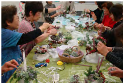
キャンドルリースづくりの様子