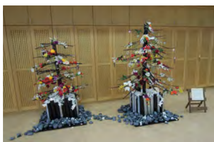
学生たちによる作品