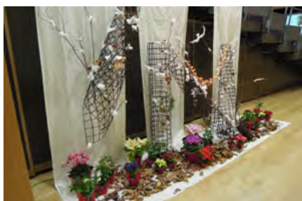
ホール入口のおもてなしオブジェ