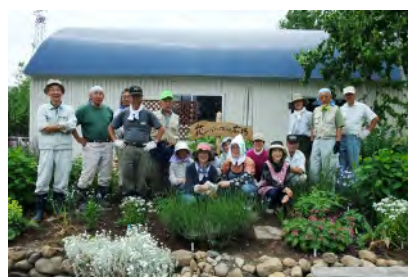
花いっぱい広場で記念撮影