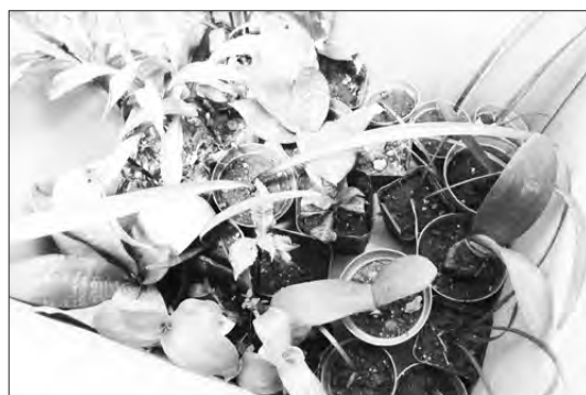
たくさん集まった苗のほんの一部です

交換タイムの後は、お茶を飲みながらくつろいだ雰囲気に参加者同士が交流しました。交換したタネ・苗などの育て方や、手入れのしかたなど、お話も盛り上がり、楽しい時間を過ごすことができました。