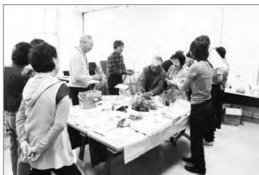
タネ・苗交換タイム