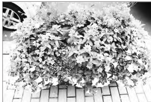
①②班作成のコンテナ

現在、コンテナをきれいな状態に保つため、「メンテナンスデー」を週1回設けてコンテナの様子を見たり、花がらつみなどのメンテナンスを行っています。