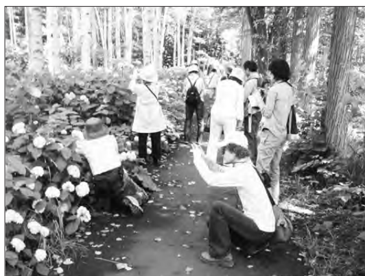
アジサイを撮影中