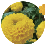
マリーゴールド デイスカバリー