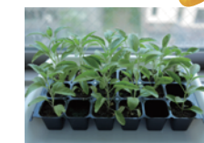
セルトレイでの育苗のようす