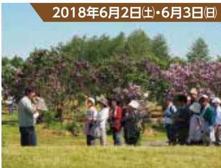
2018年6月2日(土)・6月3日(日)