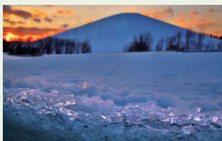
2022グランプリ「Crystal Evening」 黒木一浩さん 撮影場所:モエレ沼公園