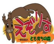
一般社団法人 とも育ちの森 えぞりす

発表時間は、1 団体 10 分程度です。欠席の団体については、主催者が報告書を代読します。