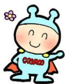
NPO 法人こどものへや COSMOS