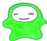
自然遊びの会 ころっぽ