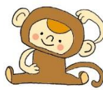
ニコニコ会 CO ザル CO