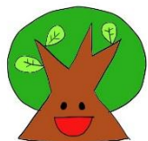
自然遊びの会 遊木森森