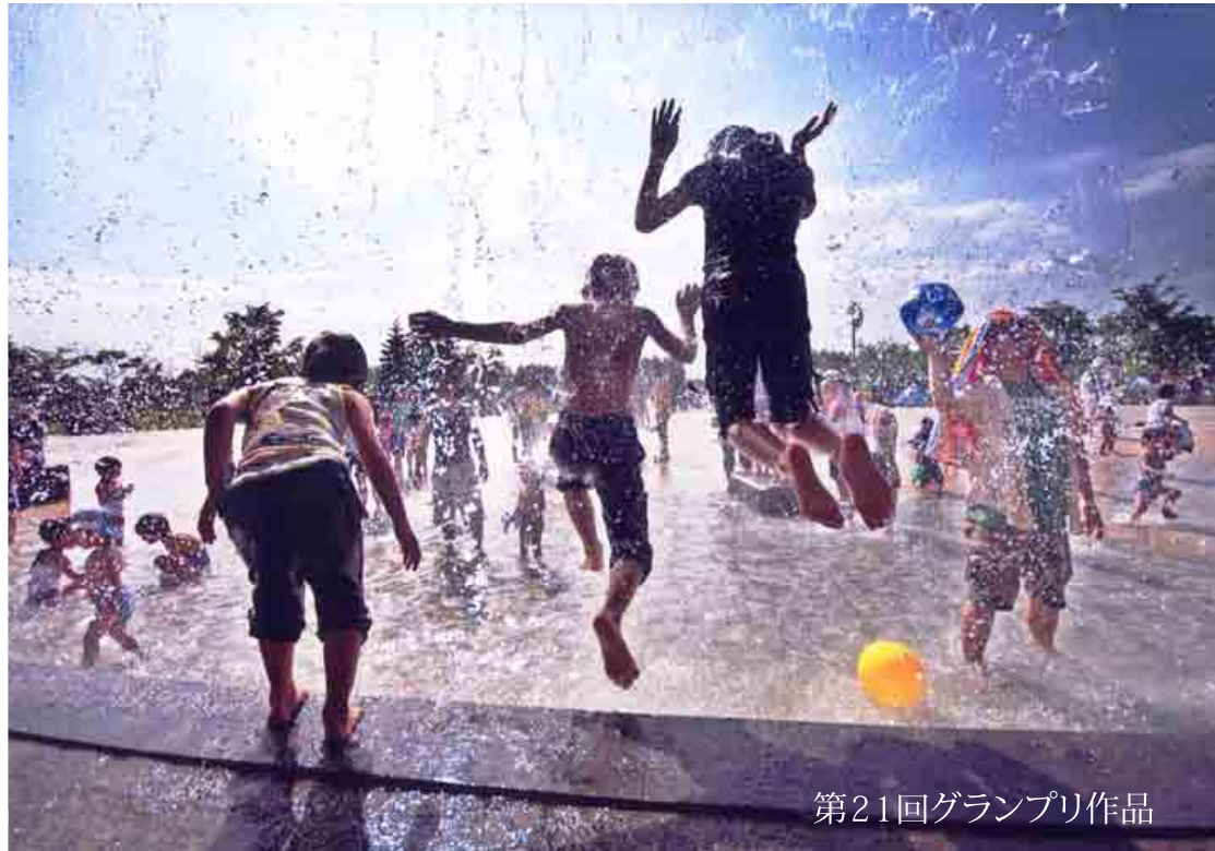
第21回グランプリ作品