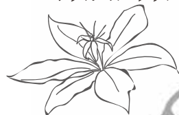
↓クルマバツクバネソウ