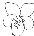
タチツボスマイレ

札幌市の開花予想は4月30日 見頃はG.W後半になりそうです。 花木広場ではサクラにメジロやイカル、 オオルリなどが集まります。