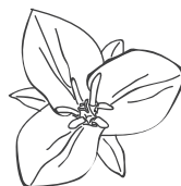
オオバナノエンレイソウ