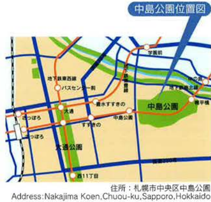
住所：札幌市中央区中島公園 Address: Nakajima Koen, Chuoh-ku, Sapporo, Hokkaido