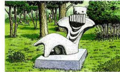
彫刻・碑像 ● 公園内にはまちの歴史と深いかわりを持つ、数々の彫刻や碑像があります。札幌出身で全国に作品を残した山内壯夫(やまのうち・たけお 1907~75)の彫刻も、「猫とハーモニカ像」などがあります。