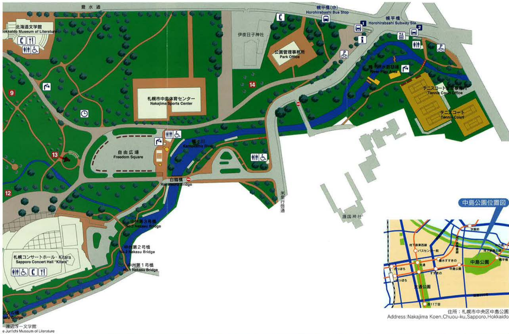
源 俊 忠 文 学 館 e Jun'ichi Museum of Literature