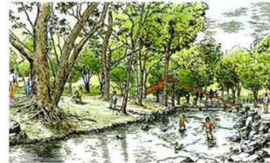
鴨々川水遊び場 ● 子どもたちが水と自由に遊べる木漏れ日のさわやかなスポット。都心部で水遊びができる川として、夏は親子連れでにぎわいます。