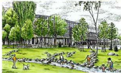
札幌コンサートホールKitara ● 1997年に開館した、北海道初の音楽専用ホール。優れた音響と荘厳なパイプオルガンの調音で、日本を代表するコンサートホールのひとつと評価を集めています。