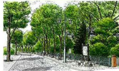
公園橋と散策路 ● 公園の西の縁、鴨々川の清流沿いには、気持ちの良い緑の散策路。川をまたぐ5本の橋がありますが、公園橋のあたりから見る豊平橋は、公園のベストビューのひとつです。