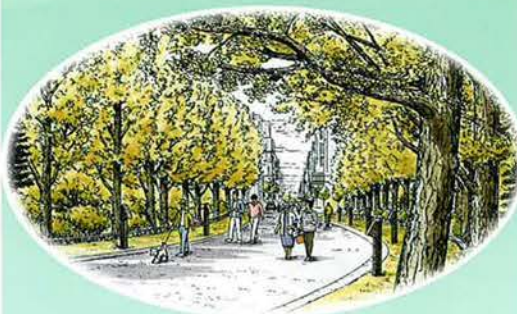
南9条通入口のイチョウ並木