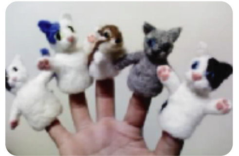
※写真は作品例です。