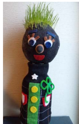
かわいい「芝ぼうや」を一緒につくりませんか？