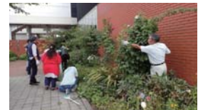
地域の人たちと一緒に作業します