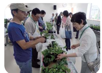
昨年の「春のタネ・苗交換会」