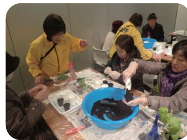
種まき体験コーナー