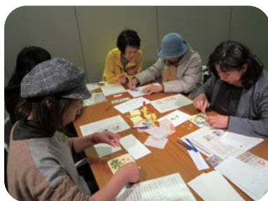
押花クラフト体験コーナー