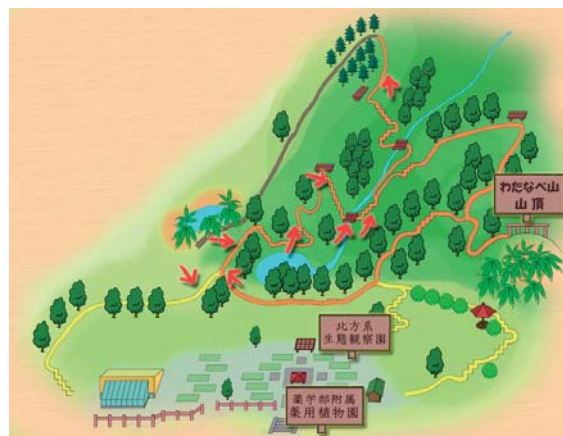
薬用植物園と北方系生態観察園

北方系生態観察園は、薬用植物園に隣接する広大な保安林内にあり、約 200 種類以上確認されている自生の植物は、散策路を巡って観察することができます。見学会開催時期は、トチバニンジンの大群落の開花や、今では札幌でなかなか見られなくなった昆虫に出会えるかも知れません。