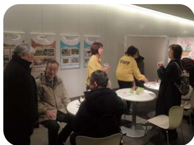
パネル展示コーナー

3 月 7 日（水）札幌駅前通地下歩行空間で、花と緑のボランティア団体とさっぽろタウンガーデナーの活動を紹介するイベントを開催しました。団体紹介のパネル展示、メッセージコーナー、押花クラフト・種まき体験の 3 つのコーナーを設け、通りがかりのたくさんの方にお集まりいただきました。体験コーナーには開始前から順番待ちの列ができ、スタッフも驚きの大盛況でした。