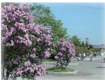
百合が原公園正面入口の様子