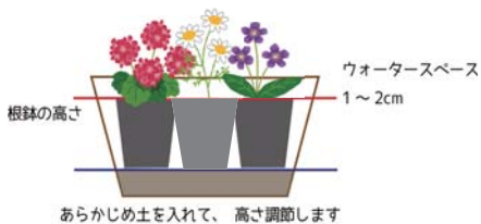
あらかじめ土を入れて、高さ調節します