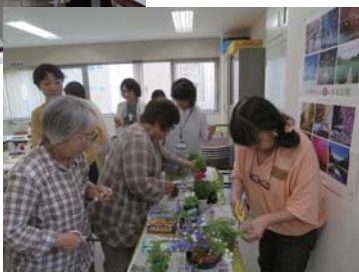
押し花づくりの練習