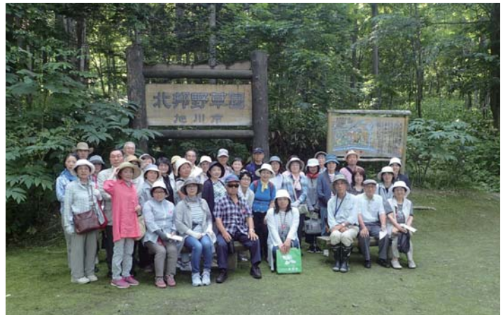
緑陰のおかげで暑さが和らぎます