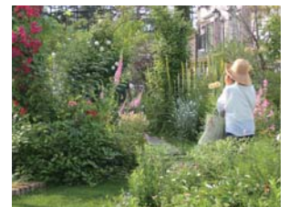
風花のイングリッシュ ガーデン風見本園