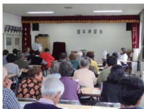
6月に開催した園芸講習会