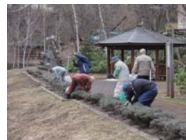
冬囲い撤去活動の様子