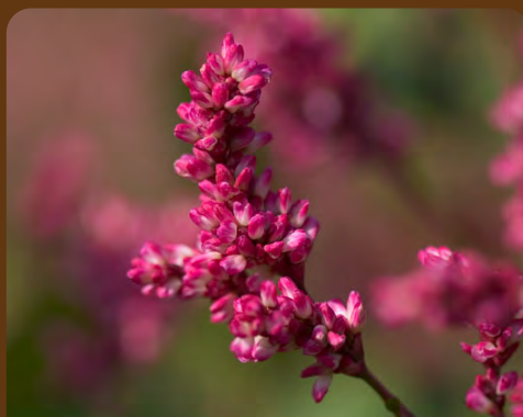
北海道医療大学薬学部 薬用植物園・北方系生態観察園