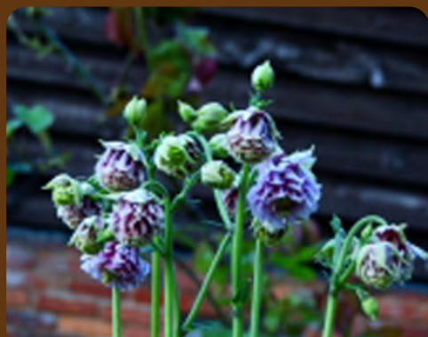
リトルロックヒルズ

9:30 札幌ターミナル出発 (9:15 集合) ＝リトルロックヒルズ見学・昼食 (約 120 分) ＝北海道医療大学薬学部 薬用植物園・北方系生態観察園見学 (約 120 分) ＝石狩はまなすの丘公園見学 (約 40 分) 17:30 頃 札幌ターミナル着