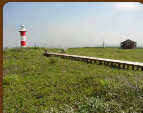
石狩はまなすの丘公園