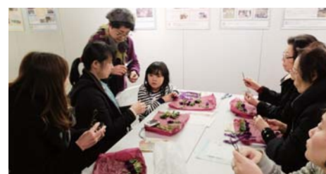
アルミの針金でつくった入れ物に、アート水苔というアクリルの紐を根元に巻きつけた多肉植物を植え込んだおしゃれなインテリアプランツをつくりました