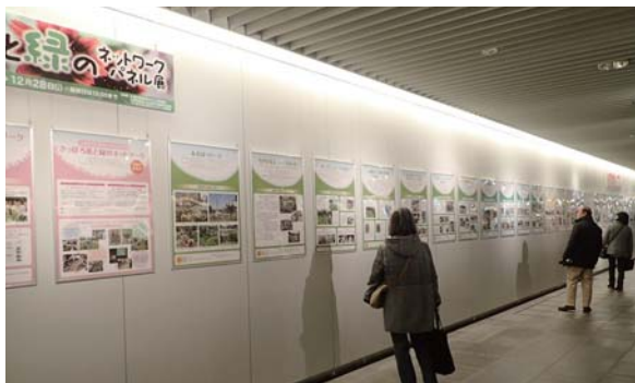
ボランティア団体のパネルを熱心に読む歩行者

12月25日(金)から28日(月)の4日間、札幌駅前通地下歩行空間で「さっぽろ花と緑のネットワークパネル展」を開催しました。雪の降り積もる中、たくさんの方々に足を運んでいただきました。