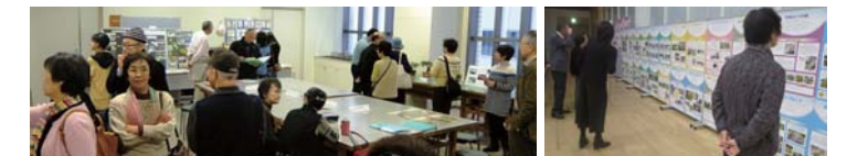
活動風景ギャラリーでは来場者と登録団体との交流も 花と緑のボランティア団体のパネルを展示

ボランティア団体活動事例発表では、各種大臣表彰を受賞された3団体が日頃の活動や、活動を続けるための工夫などについて発表しました。参加者からは「ボランティア団体について知らなかった」「ぜひ見習いたい」などの声があり、団体の皆さんの取組を知っていただく大変良い機会になりました。ご来場いただいた皆さん、ご協力してくださったタウンガーデナー・登録団体の皆さん、本当にありがとうございました。