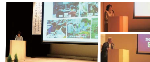
活動事例発表の様子 ガーデニング リラの会(左)、NPO法人森林遊びサポートセンター(右上)、NPO法人北海道森林ボランティア協会(右下)