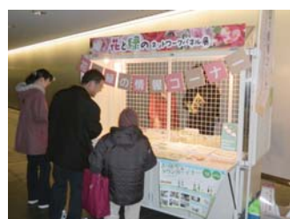
花と緑のネットワーク関係のほか、公園情報、園芸に関するパンフ等を配架