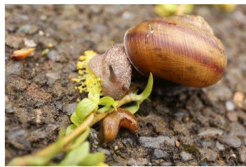
↑柳の花を食べるエゾマイマイ