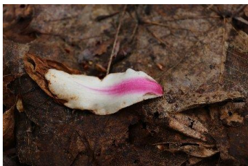
↑キタコブシの花びら