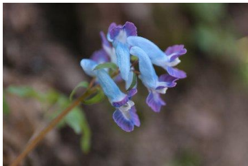
↑花びらの色が違うエゾエンゴサク