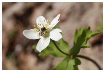
↑旭山では少ないニリンソウ