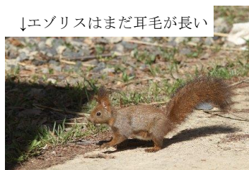
↓エゾリスはまだ耳毛が長い