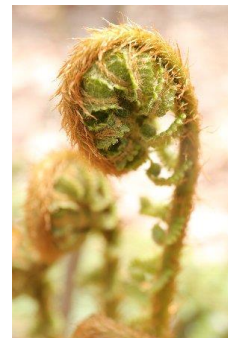
↑オシダ(シダ類、右も)