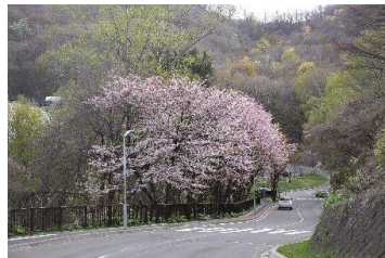
☆第一駐車場入口の桜並木