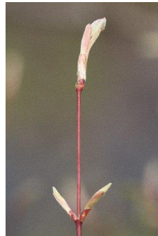
↑ハウチワカエデ新芽