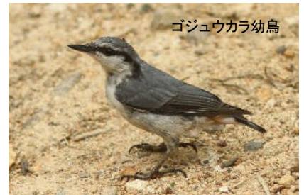
ゴジュウカラ幼鳥