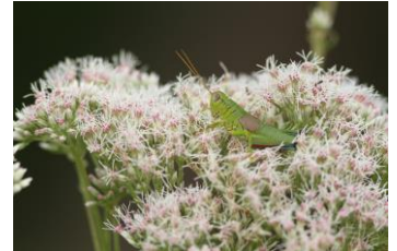
ヒヨドリバナとミカドフキバッタ