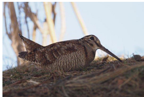
ヤマシギ 2014年3月27日撮影

また、旅鳥のマミチャジナイ、シロハラ、カシラダカも1～3日見られる可能性があります。