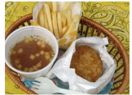
※軽食はイメージ映像です